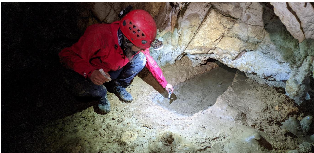
Nova Baračeva špilja (autor: Tin Rožman)

Ukupno je zabilježeno 100 različitih svojti. Ukupnom brojnošću su dominirali skokuni (Collembola) s 45%, nakon kojih slijede pauzi (Araneae) s 12%, te kornjaši (Coleoptera) i jednakonožni rakovi (Isopoda), svaki s po 10% od ukupne brojnosti faune. Ostale zastupljenosti su bile puževi (Gastropoda) 6% i lažištupavci (Pseudoscorpiones) 5%, dok su dvojenoge (Diplopoda) i rakušci (Amphipoda) bili 4% od ukupne brojnosti. Ostale skupine su bile zastupljene s malim postotkom: strige (Chilopoda) su bile svega 1%, dok su ostale skupine bile s udjelom manjim od 1%.