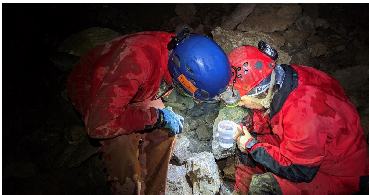
Dumenčića špilja

Kroz 2023. i 2024. godinu Javna ustanova Baraćeve špilje u suradnji sa Hrvatskim biospeleološkim društvom provela je jedno sveobuhvatno istraživanje/monitoring punog naziva „Praćenje ključnih i indikatorskih vrsta za podzemna staništa kojima upravlja Javna ustanova Baraćeve špilje“.